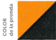
COLOR de la prenda